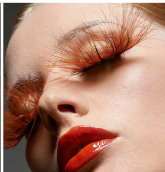
Avant Garde Makeup.