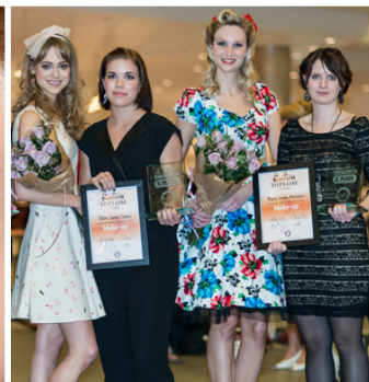
20 DM Titler.